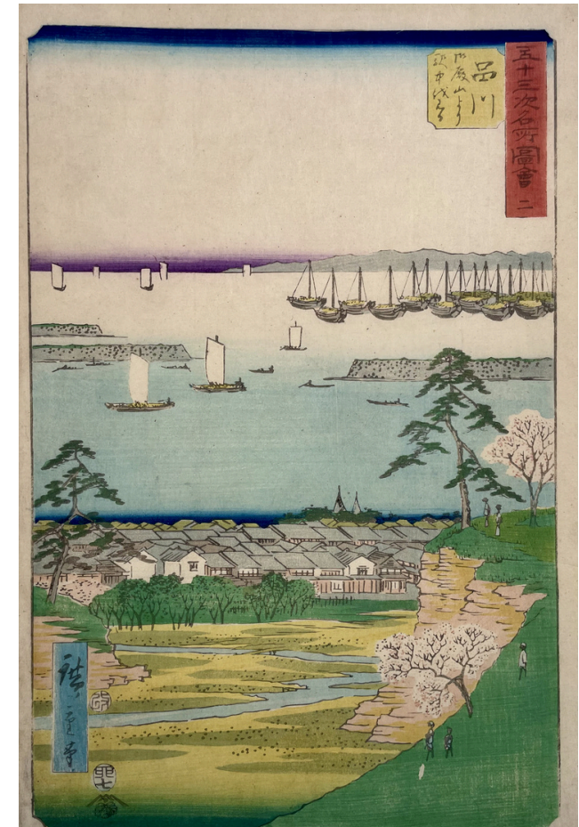
Utagawa HIROSHIGE (1797-1858), Shinagawa : Vue de la gare depuis Goten-yama (Shinagawa, Goten-yama yori ekijû o miru), planche n°2 (verticale) de la série Les Cinquante-trois stations du Tokaido (Gojûsan tsugi meisho zue)