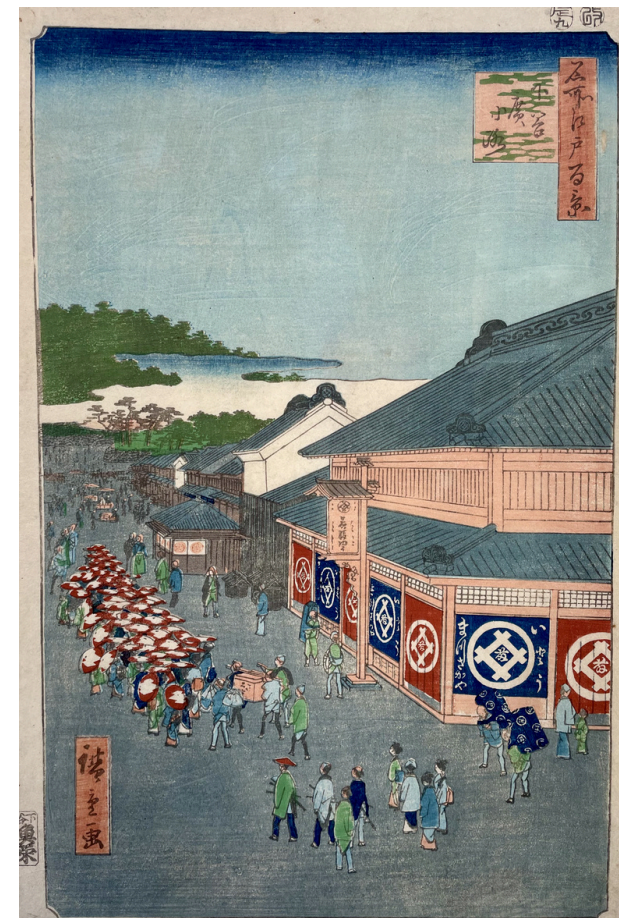
Utagawa HIROSHIGE (1797-1858), La rue Hirokōji (Shitaya Hirokōji) , planche n°13 de la série Les Cent vues d'Edo (Meisho Edo hyakkei)

Gravure sur bois nishiki-e au format oban Tate-e, 1856