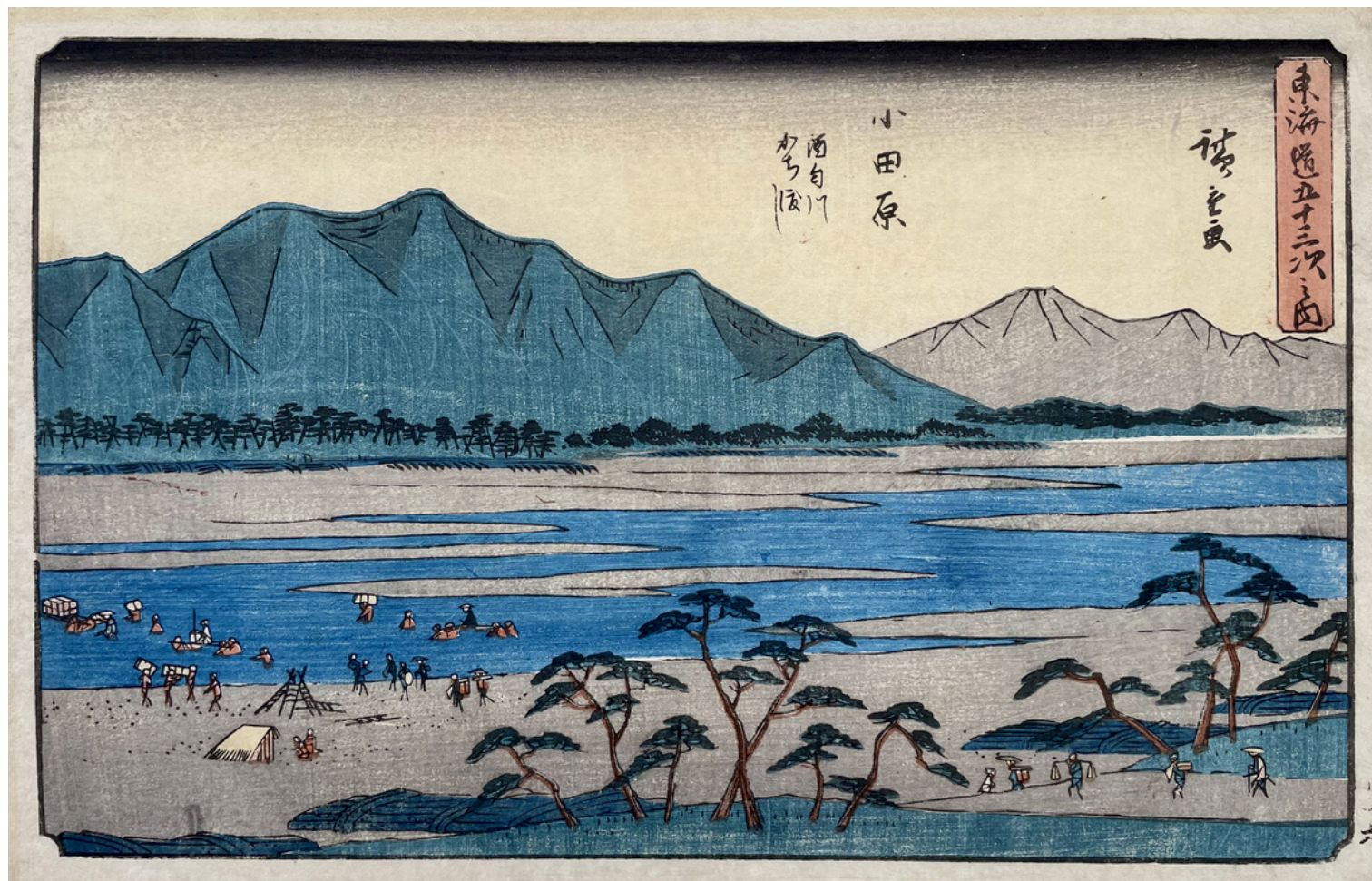
Utagawa HIROSHIGE (1797-1858), Odawara : la traversée de la rivière Sakawa (Odawara, Sakawagawa kachiwatashi) , planche n°10 (Gyosho) de la série Les Cinquante-trois stations du Tokaido (Gojūsan-tsugi no uchi)

Gravure sur bois nishiki-e au format aiban yoko-e, 1841-44