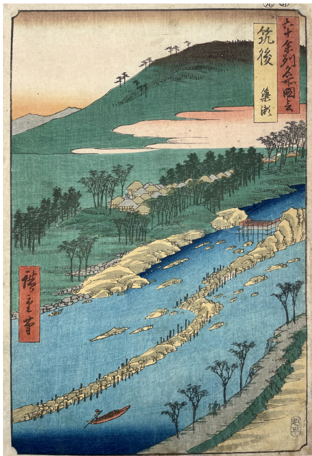
Utagawa HIROSHIGE (1797-1858), Province de Chikugo : Les courants autour du barrage (Chikugo, Yanase) , planche n°60 de la série Lieux célèbres des Soixante Provinces (Rokujūyoshū meisho zue)

Gravure sur bois nishiki-e au format oban Tate-e, 1855