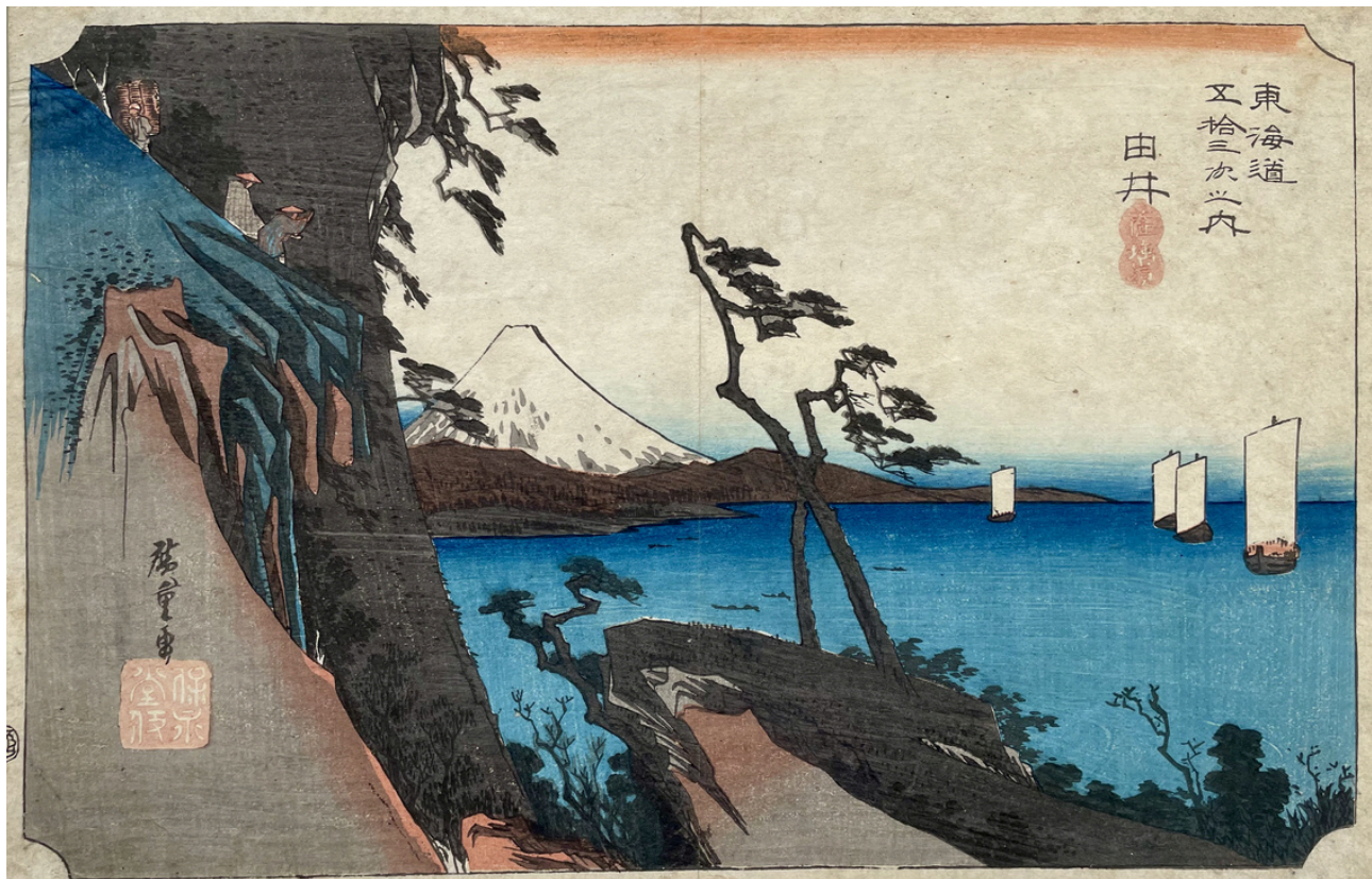
Utagawa HIROSHIGE (1797-1858), Yui, Pic de Satta (Yui, Satta mine) , planche n°17 (Le Grand Tokaido) de la série Les Cinquante-trois stations du Tokaido (Gōjūsan-tsuji no uchi)

Gravure sur bois nishiki-e au format oban yoko-e, 1833-34